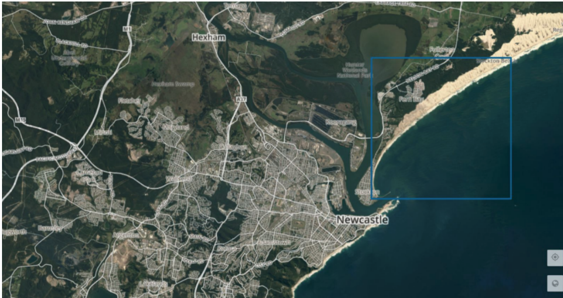
Satu Quad dalam sebuah peta dasar